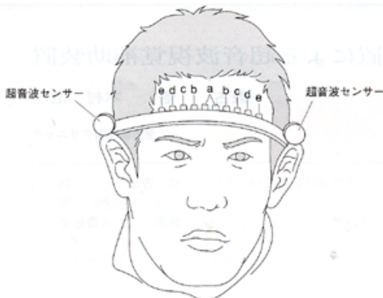
図1 皮膚刺激素子の配置

神経刺激素子は、装着バンドの内側に、左右対称に取り付けられ、近距離を担当する素子ほど中央に配置することで、心理的な遠近感と実際の対象物の遠近を一致させた。